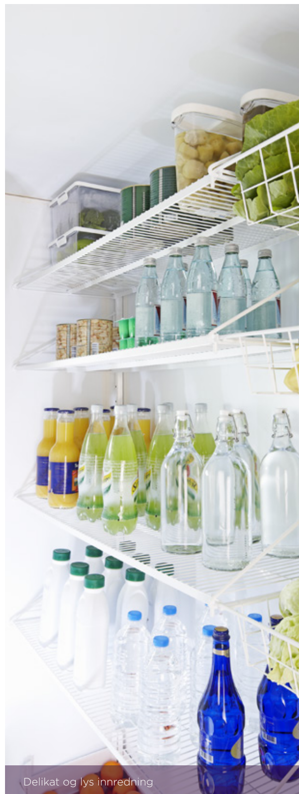
Delikat og lys innredning