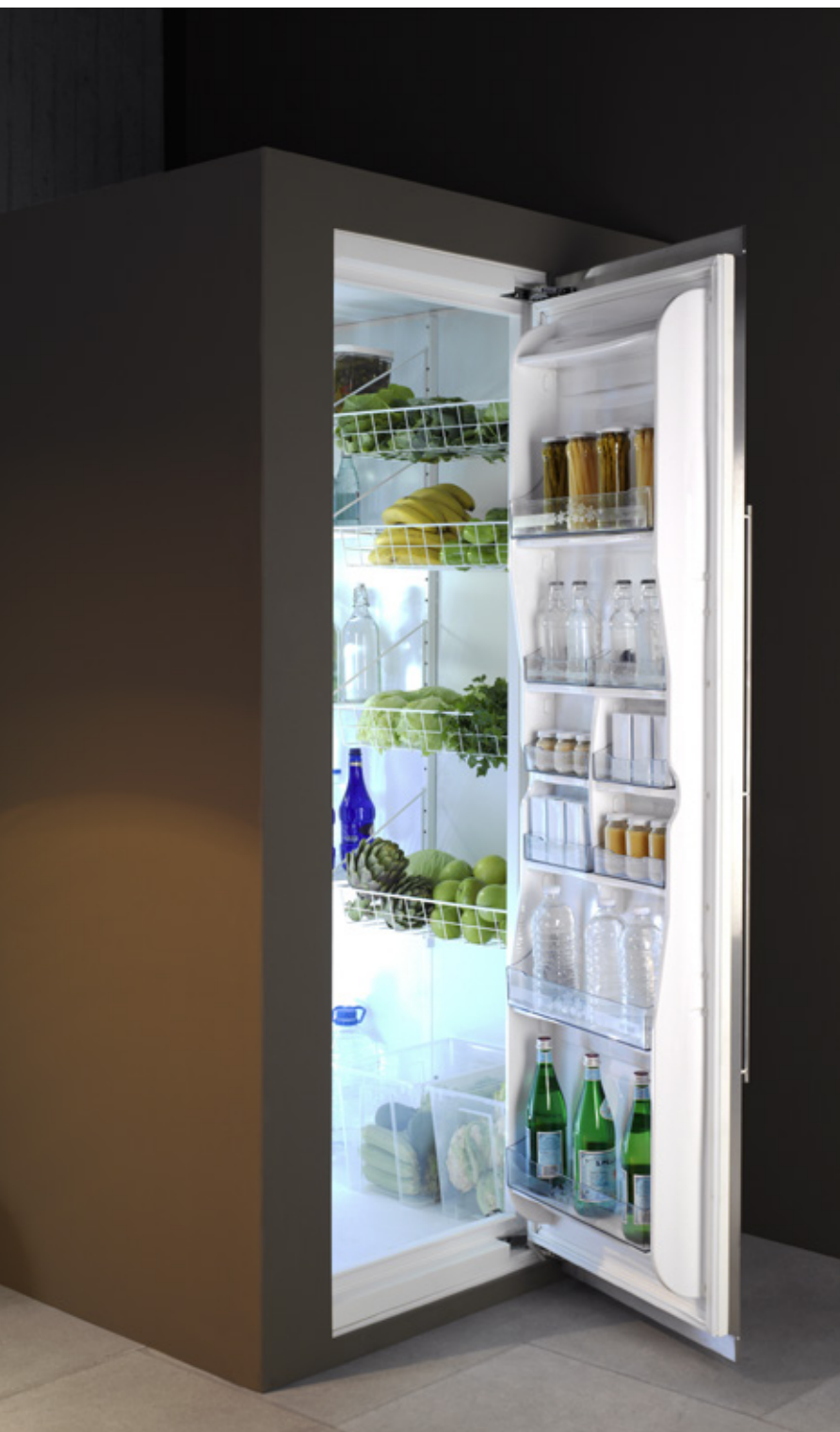
Stor lagringskapasitet gir mange muligheter